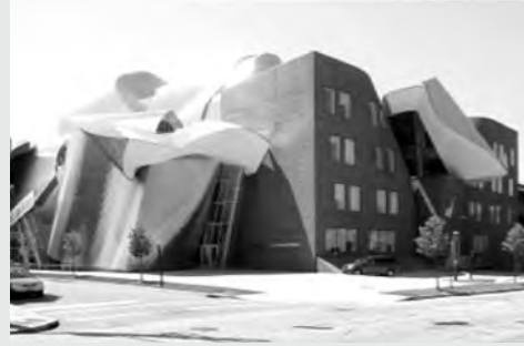
Weatherhead School of Management, Frank Gehry

işletme alanında teori ve pratiği özgün şekilde sunarak öğrencilerini bütüncül yetiştiriyor. ABD'de cesur fikirlerin çıktığı ve radikal bir okul olarak nam salmış. Frank Gehry'e yaptırdıkları ve 60 milyon dolara mal olan okul binası, Peter B. Lewis Building, etrafındaki binaların sıradanlığının içinde farklılığı ve yenilikçiliğiyle cesurca yükseliyor. Bu haliyle, işletme okulunun kimliğini de hakkıyla yansıtıyor.