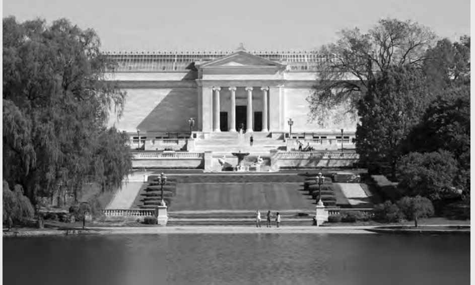
Cleveland Museum of Art

Cleveland, ABD’de bir şehre büyüklük atfettiren pek çok şeye sahip: Basketbol, beyzbol, Amerikan futbolu gibi ilgiyle takip edilen spor dallarında mücadele eden takımlar, sanat ve gösteri merkezleri, festivaller, büyük alışveriş merkezleri, bütün önde gelen markalar, 72 milletin restoranları, müzeler ve dahası... Ancak, bunların hepsini zamanında pesinden getiren sanayinin başka ülkelere kaymasıyla, Cleveland geçmişteki parlaltısını yitirmiş. Hayat pahalılığı büyük şehirler arasında en düşük düzeye inmiş. Bütün bunlar bu şehri doktora yapmak için ideal kılıyor: Bir şehirde arayacağınız hemen her şeyi bulabiliyorsunuz, ama çok azı kendinize “Haydi çıkıp göreyim!” dedirtecek kadar çekici.