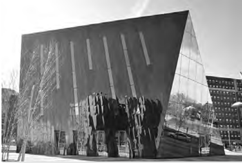
Museum of Contemporary Art of Cleveland

University Circle'ın içinde Little Italy (Küçük İtalya) mahallesi de yer alıyor. Adı üstünde, burası lokantaları, bakkalı, fırını, kilisesi, terzisi ile Cleveland'a göç eden İtalyanların yerleştiği tam bir İtalyan mahallesi. Ancak günümüzdeki neslin çoğu İtalyanca bilmiyor ya da Napoli lehçesi konuşuyor. Bazen oradaki Piestri's Bakery'e ekmek almak için gidiyorum. Başlarında duran şirin, yaşlı bir teyze ile birlikte bütün çalışanlar çok se-