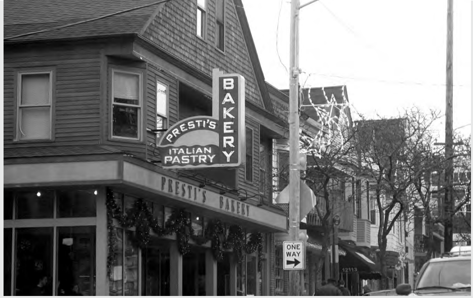
Presti's Bakery, Little Italy

ve beyazlar kaçıyor, burası hâlâ tamamen beyaz diye anlatıyor. Okul şehrin içinde olmasına rağmen güvenliği zayıftı. Geçen sene mail kutumuza hava karardıktan sonra işlenmiş suçlara dair raporlar geliyordu. Bir hocam bana hava karardıktan sonra okuldan otoparka yürümesi gerekiyorsa, yüzüklerini ters çevirip öyle yürüdüğünü söylemişti. Neyse ki, bu sorun ortadan kalkmaya başladı. Ben okula üç-dört dakika yürüyüş mesafesinde oturuyorum ve geçen sene evimin dibine bir market, karşısına da pek çok lokanta açıldı. Elhamdulillah. Etrafta geç saatlere kadar ışık ve insanlar olunca, suç sayısı düştü. Belediye açılan market ve lokantalara sunduğu vergi, kira, vb. teşviklerin karşılığını bu şekilde de alıyor.