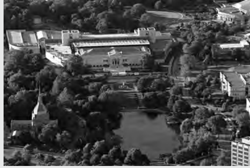
Cleveland Museum of Art

University Circle'da geçen sene Rembrandt'ın sergisinin ABD'de uğradığı sayılı adreslerden olan Cleveland Museum of Art, sergilerine binasının bizzat kendisiyle başlayan Museum of Contemporary Art of Cleveland, dünyanın en iyi üç klasik müzik orkestrasından biri olan Cleveland orkestrasının (kendilerine sorarsanız dünyanın en iyi klasik müzik orkestrası) sahne aldığı Severance Hall ve Cleveland Botanical Garden yer alıyor. Cleveland Orkestrası'nun şefine bir röportajda dünyanın en iyi orkestralarından birisinin bu şehirde olmasının garip olup olmadığı sorulunca, benim doktora için düşündüklerime benzer bir yanıt vermiş: "Cleveland'da